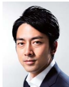
衆議院議員 自民党農林部会長 小泉 進次郎