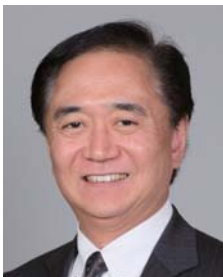
神奈川県知事 黒岩 祐治