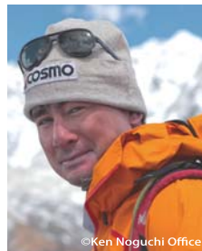
アルピニスト 野口 健