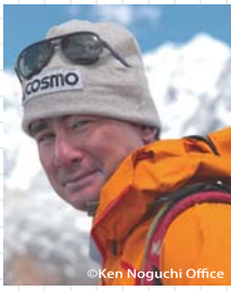
アルピニスト 野口 健