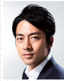
衆議院議員 自民党農林部会長 小泉 進次郎

高校時代に植村直己氏に感銘を受け、登山を始める。 1999年、エベレストの登頂に成功し、当時、7大陸最高峰世界最年少登頂記録を25歳で樹立。 2000年からはエベレストや富士山に散乱するごみ問題に着目して清掃登山を開始。 2016年4月に起きた熊本地震では、避難所としてのテント村の設置、運営などの支援を行った。