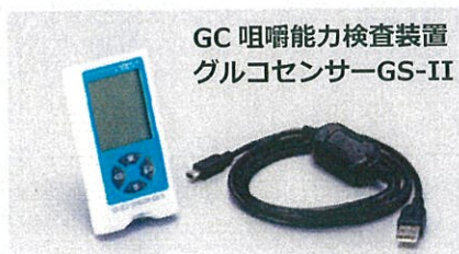
GC咀嚼能力検査装置 グルコセンサーGS-II